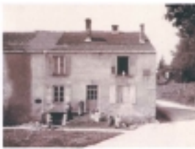
La maison natale de Camille Flammarion. Il y réside jusqu'en 1856.

Nicolas Camille Flammarion , plus connu sous le nom de Camille Flammarion , né le 26 février 1842 à Montigny-le-Roi (Haute-Marne), mort le 3 juin 1925 à Juvisy-sur-Orge, était un astronome français.